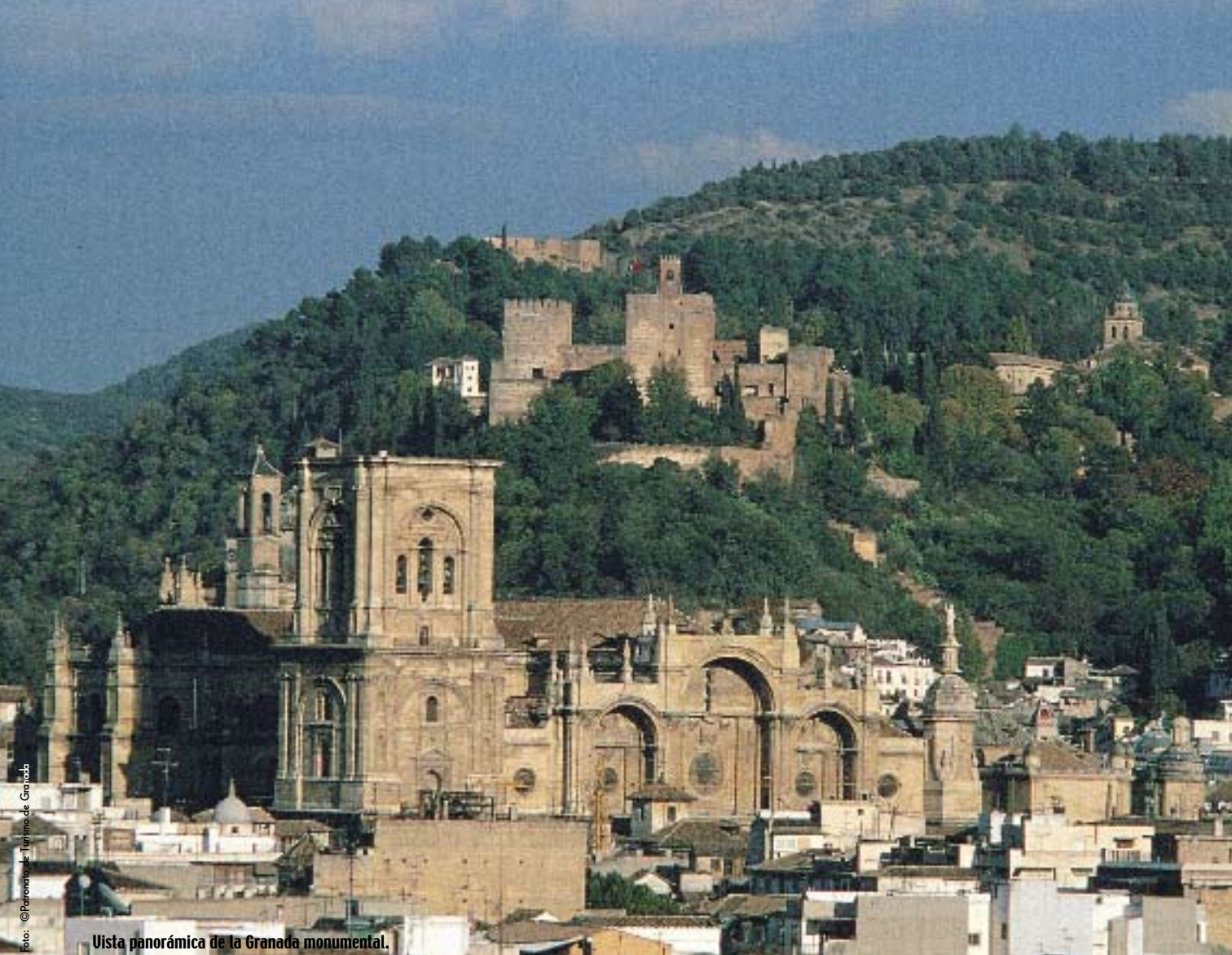
Vista panorámica de la Granada monumental.

Existe un placer todavía mayor que el de ver Granada: Volverla a ver. El itinerario carolino que proponemos en estas páginas permiten contemplar la ciudad bajo otros ojos: los de un emperador fascinado por la magia que de ella emana y a la que quiso convertir en capital imperial. Los circuitos habituales son fiel reflejo del esplendor de la antigua ciudad nazarí o de un magnífico enclave medieval, ya gótico-mudéjar, bajo el reinado de los Reyes Católicos.