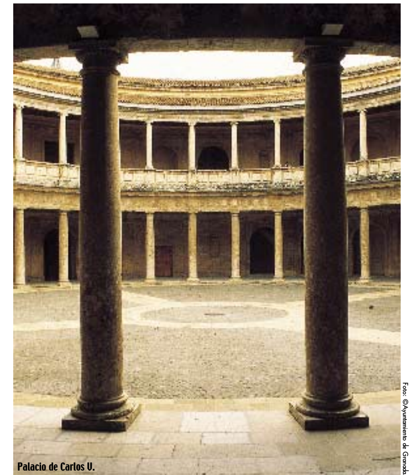
Palacio de Carlos V.

El resultado es un recorrido repleto de historia, alejado de la Granada más exótica y romántica, las que exaltaron los románticos en los siglos XVIII y XIX, pero absolutamente imprescindible para el viajero que quiera descubrir todas las facetas de esta ciudad mágica. Lugares como el Palacio de Carlos V, junto a la Alhambra, escenario de espléndidas fiestas cortesanas; el Monasterio de San Jerónimo, residencia de la emperatriz Isabel y lugar de actividades artísticas y literarias; o los hermosos bosques de los alrededores, testigos de frecuentes jornadas de caza. Estos y otros enclaves fueron algunos de los hitos más famosos de un tiempo de esplendor, cuando Granada se preparaba para ser capital imperial. La historia deparó para la ciudad otro futuro. Pero un Carlos V cansado y enfermo, recluso voluntariamente en Yuste al final de su vida, recordaría este tiempo como una de las épocas más felices de su vida.