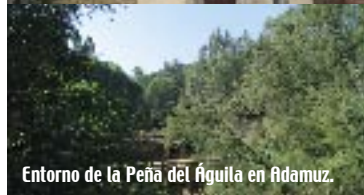
Entorno de la Peña del Águila en Adamuz.