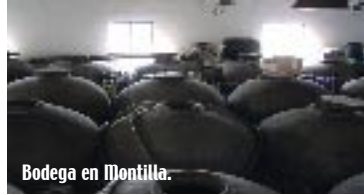
Bodega en Montilla.