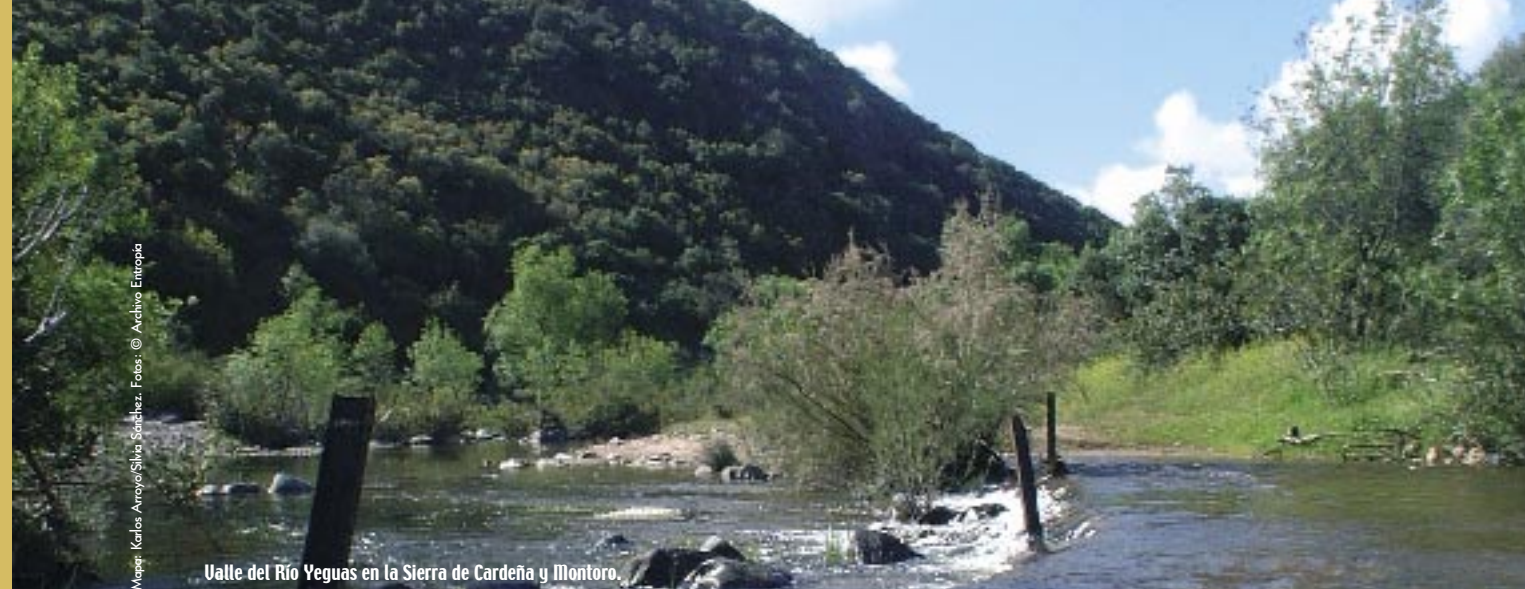
Valle del Río Yeguas en la Sierra de Cardeña y Montoro.