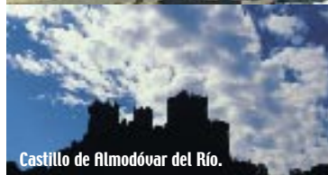
Castillo de Almodóvar del Río.