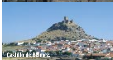
Castillo de Belmez.