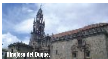
Hinojosa del Duque.