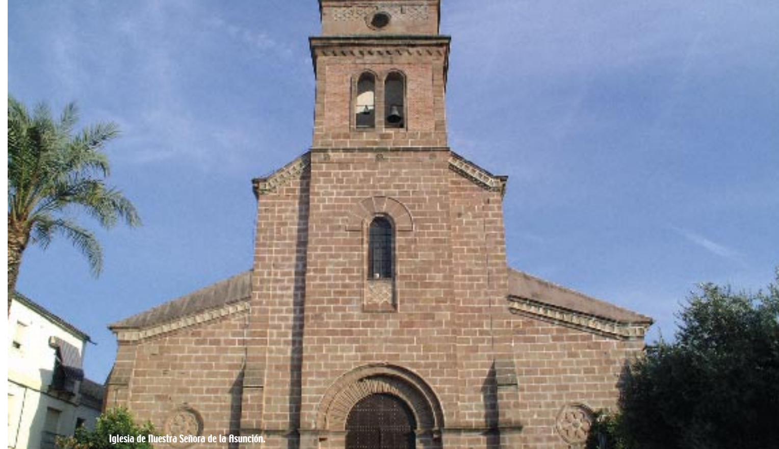
Iglesia de Nuestra Señora de la Asunción.

1537 bajo la dirección de Hernán Ruiz I. En su clave figura una bella laurea renacentista con escudo taqueado que se corresponde con las armas del obispo Fray Juan Álvarez de Toledo, bajo cuyo episcopado se hizo esta portada. A poca distancia se levanta la parroquia de la Inmaculada Concepción. Es un templo de buena y cuidada construcción en piedra molinaza y ladrillo, típica del eclecticismo arquitectónico de comienzos de siglo. Su interior tiene tres amplias naves abovedadas con arcos de medio punto sobre pilares realizados con columnas adosadas. Asoma a la calle con robustos muros coronados en modillones de rollos, imitando el estilo musulmán. Su noble fachada