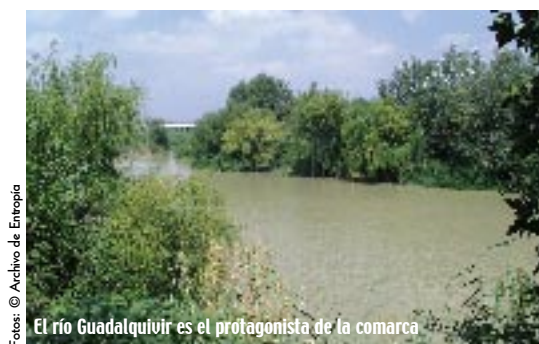
El río Guadalquivir es el protagonista de la comarca

En una antigua casa de la villa, colindante con la parroquia de Inmaculada Concepción, se encuentra la Casa Museo Manolete, dotada de unos fondos pertenecientes a la historia del torero cordobés Manuel Rodríguez Sánchez “Manolete”, que la hacen única en el mundo por la enorme cantidad de documentos y objetos del matador. El escritor y biógrafo de Manolete, Paco Laguna, ha recopilado en su magistral obra “Tauromaquia de Manolete” una muestra de parte de los archivos que se encuentran en este museo que, además cuenta con un valioso archivo fotográfico, una colección de cartelería, una biblioteca y una pinacoteca dedicada a la historia taurina, apta para estudiosos e investigadores. El museo también edita revistas alusivas al tema y organiza diferentes exposiciones itinerantes. También relacionado con el mundo de los toros y natural de estas tierras fue el famoso periodista Matías Prat, cuya labor profesional será justamente reconocida en el museo dedicado a su persona y que será próximamente inaugurado en Villa del Río.