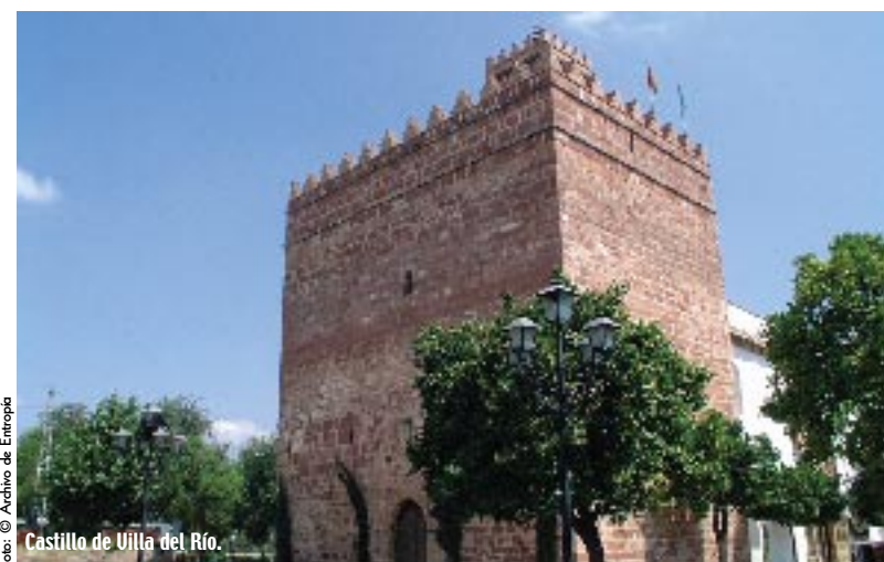
Castillo de Villa del Río.

CUNA DEL FAMOSO TORERO “MANOLETE” Y DEL RECONOCIDO LOCUTOR TAURINO MATÍAS PRAT, VILLA DEL RÍO, SITUADA EN LA PARTE ORIENTAL DE LA PROVINCIA DE CÓRDOBA, JUSTO EN EL LÍMITE CON LA DE JAÉN, RECONOCE LA IMPORTANCIA DE ESTOS PERSONAJES ILUSTRES Y LES DEDICA SENDOS MUSEOS CONMEMORATIVOS DE IMPORTANTE LABOR PROFESIONAL.