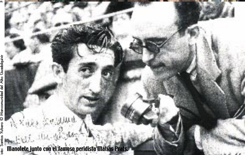
Manolete junto con el famoso periodista Matías Prat.

Villa del Río goza de un enclave privilegiado dentro de la comarca del Alto Guadalquivir, ubicada a caballo entre la sierra y la campiña baja de la provincia de Córdoba. A sólo 50 kilómetros de la capital, esta localidad recibe al visitante mostrando orgullosa su bien conservado puente romano y su ermita de la Virgen de la Estrella, en un entorno paisajístico y rural muy singular. Dentro de la arquitectura civil de Villa del Río hay que destacar en los restos del antiguo castillo