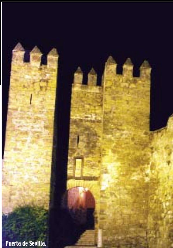
Puerta de Sevilla.