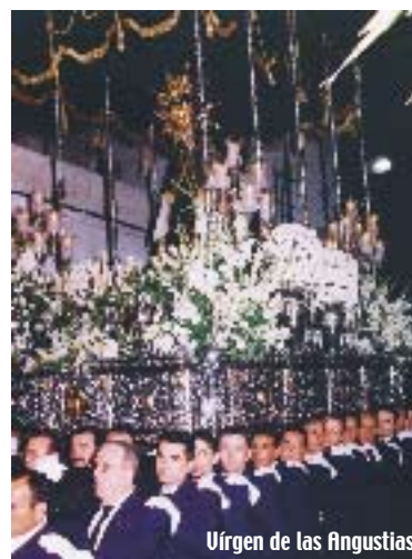
Virgen de las Angustias.

representación en nuestro país. La talla de Jesús Nazareno (Nuestro Padre Jesús para el pueblo), protagoniza "La subida de Jesús" en la que asciende, acompañado de casi 2.000 hombres en el más absoluto silencio, desde su ermita hasta el templo parroquial, donde un soldado romano lee la sentencia de Pilatos. Este es uno de los momentos más singulares de la Semana Santa, conocido como el Pregón del Judío. El Viernes Santo, por la tarde noche, realiza su estación de penitencia la Venerable