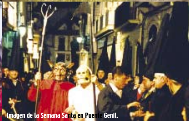
Imagen de la Semana Santa en Puente Genil.