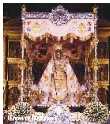
Virgen de Araceli.

devoción y fe popular. Miles de personas llevan sus flores a la Patrona, dispuestas en espléndidas canastillas delicadamente elaboradas. El primer domingo de mayo, festividad de la Virgen de Araceli, tiene lugar la procesión, colocada ya la venerada imagen en su trono barroco. A hombros de los tradicionales santeros, la talla discurre por las principales calles y plazas del pueblo, en un día convertido en punto de encuentro espiritual de toda una amplísima comarca. Por fin, el primer domingo de junio, la romería de regreso al Santuario de Aras pone punto final a