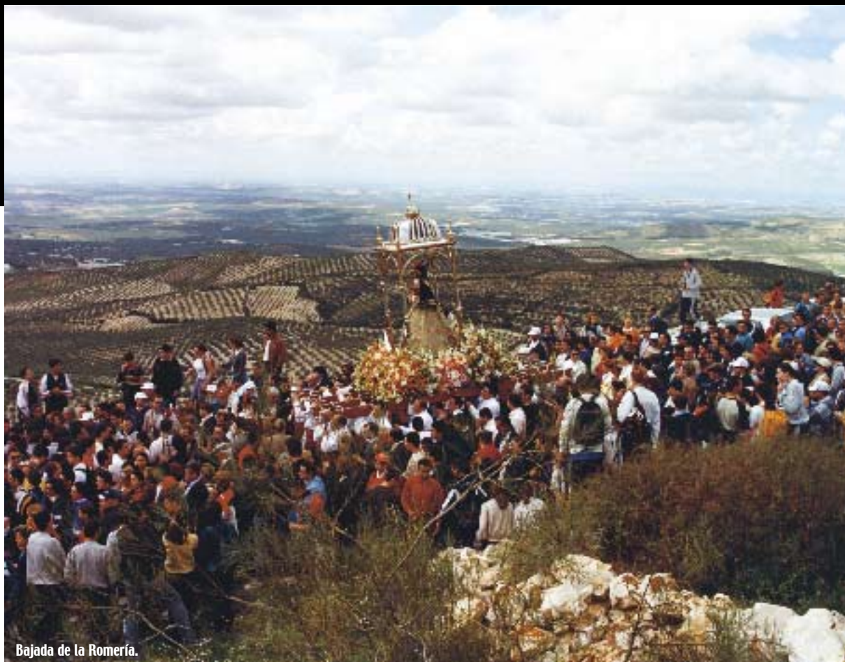
Bajada de la Romería.