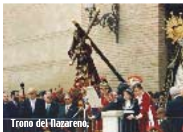
Trono del Nazareno.

Tres son las principales cofradías que procesionan cada primavera en la localidad para conmemorar la Pasión, Muerte y Resurrección de Cristo. La Real y Venerable Hermandad de San Juan Evangelista y Cristo de la Misericordia (S. XVII) realiza la estación de penitencia la noche del Jueves Santo con cuatro hermosos tronos: Oración en el Huerto, perteneciente a la imaginería sevillana; el Cristo de la Misericordia, talla policromada de la Escuela Imaginera Levantina; María Santísima de Gracia y Esperanza; y San Juan Evangelista, imagen surgida de manos de un imaginero veratense. En la mañana del Viernes Santo le toca el turno a la Real Archicofradía de Nuestro Padre Jesús Nazareno de la que ya en 1674 hay pruebas de su existencia. El paso del Lavatorio de los Pies es una entrañable talla procesionada por 62 mujeres veratenses. No se tienen noticias de se procesione actualmente ningún paso con esta