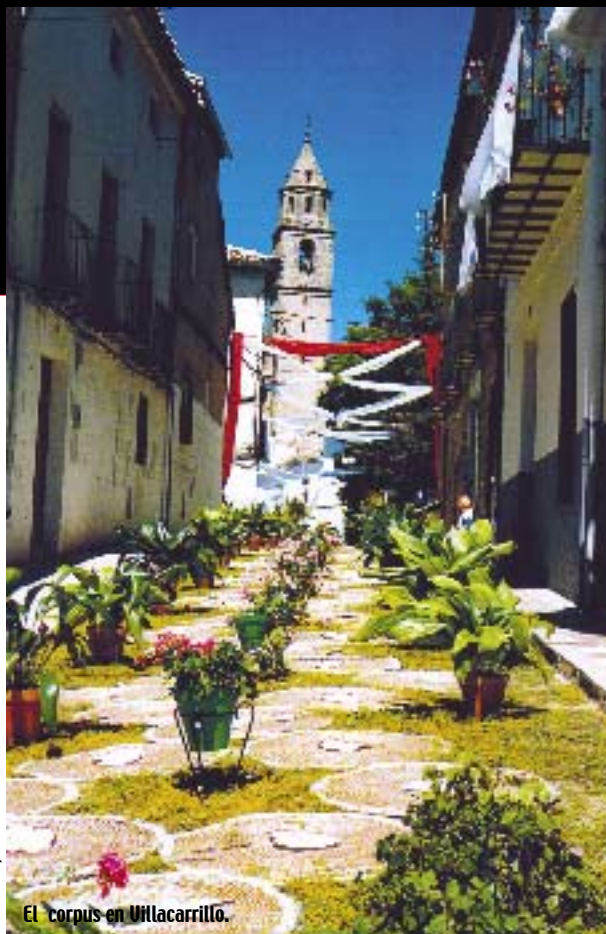
El corpus en Villacarrillo.