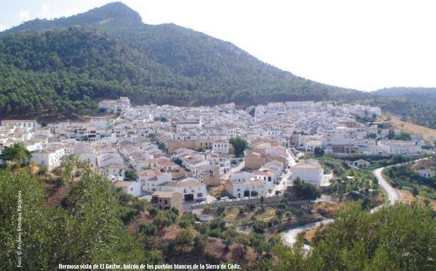
Hermosa vista de El Gastor, balcón de los pueblos blancos de la Sierra de Cádiz.