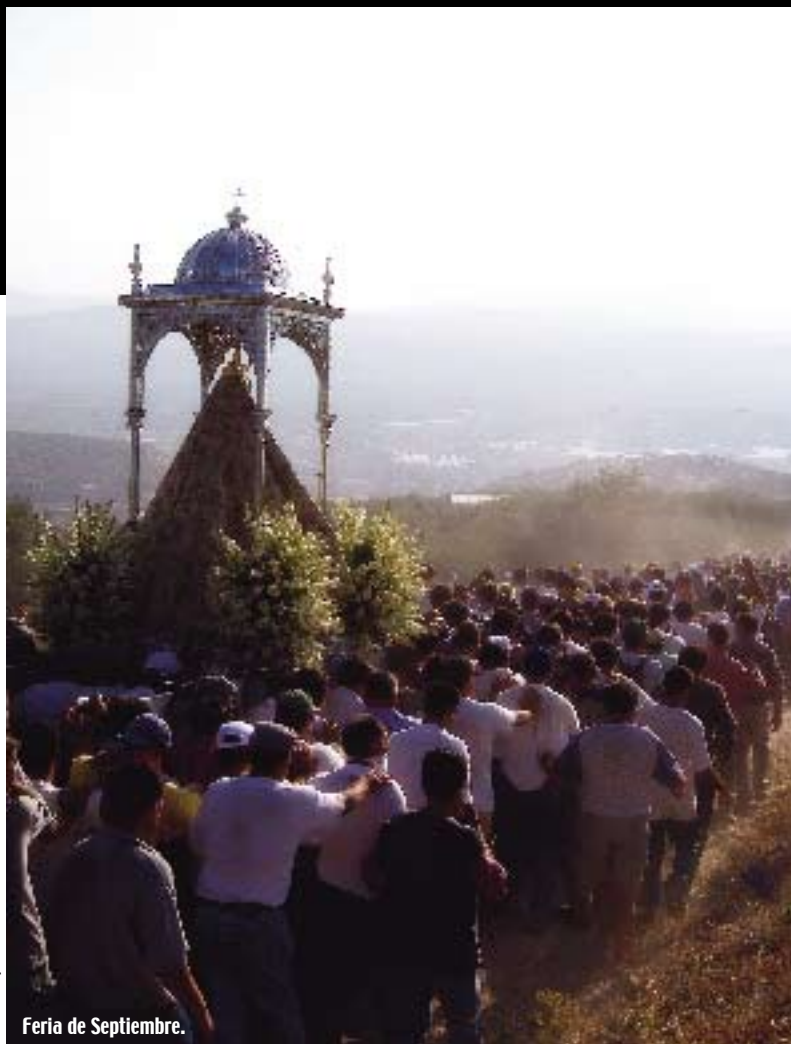
Feria de Septiembre.