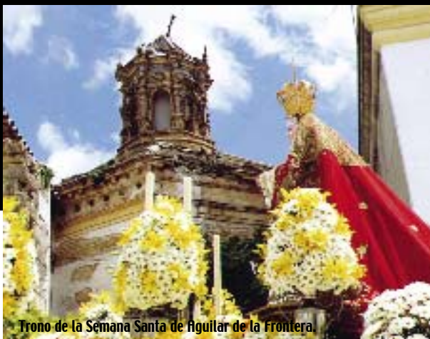
Trono de la Semana Santa de Aguilar de la Frontera.