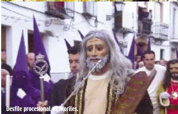
Desfile procesional en Moriles.