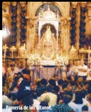
Romería de los Gitanos.

se desarrolla en medio de todo tipo de actos culturales, deportivos, recreativos y religiosos. La última jornada de feria, el día 8, nos depara la procesión de la Patrona entre el fervor de egabrenses y visitantes.