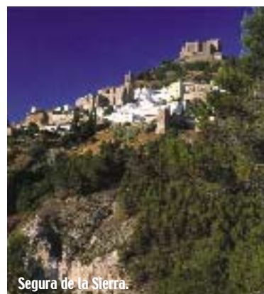
Segura de la Sierra.

de vuelo y el cine al aire libre cada noche, seguido por espectáculos musicales de excelente nivel. Además del certamen cinematográfico, donde compiten películas de todo el mundo relacionadas con los deportes de vuelo, se celebrará un concurso internacional de fotografía aérea, el cual ha adquirido gran prestigio en todo el mundo desde su puesta en marcha en el año 2002, coincidiendo con la tercera edición del Festival. Después de algunos cambios en la ubicación, la mayor parte de las actividades del Festival tienen hoy lugar en Cortijos Nuevos, un bello escenario al pie del Yelmo, monte emblemático que con sus 1.809 metros corona toda la comarca.