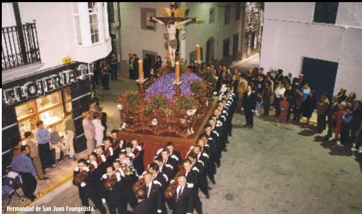
Hermandad de San Juan Evangelista.