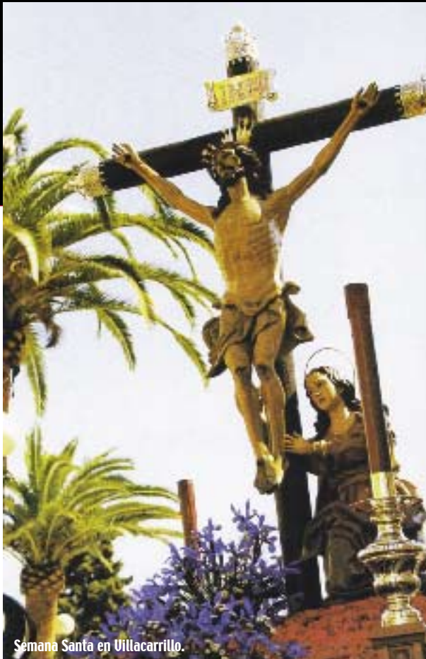
Semana Santa en Villacarrillo.