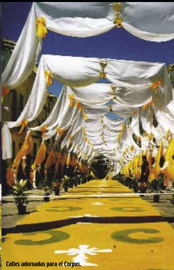
Calles adornadas para el Corpus.