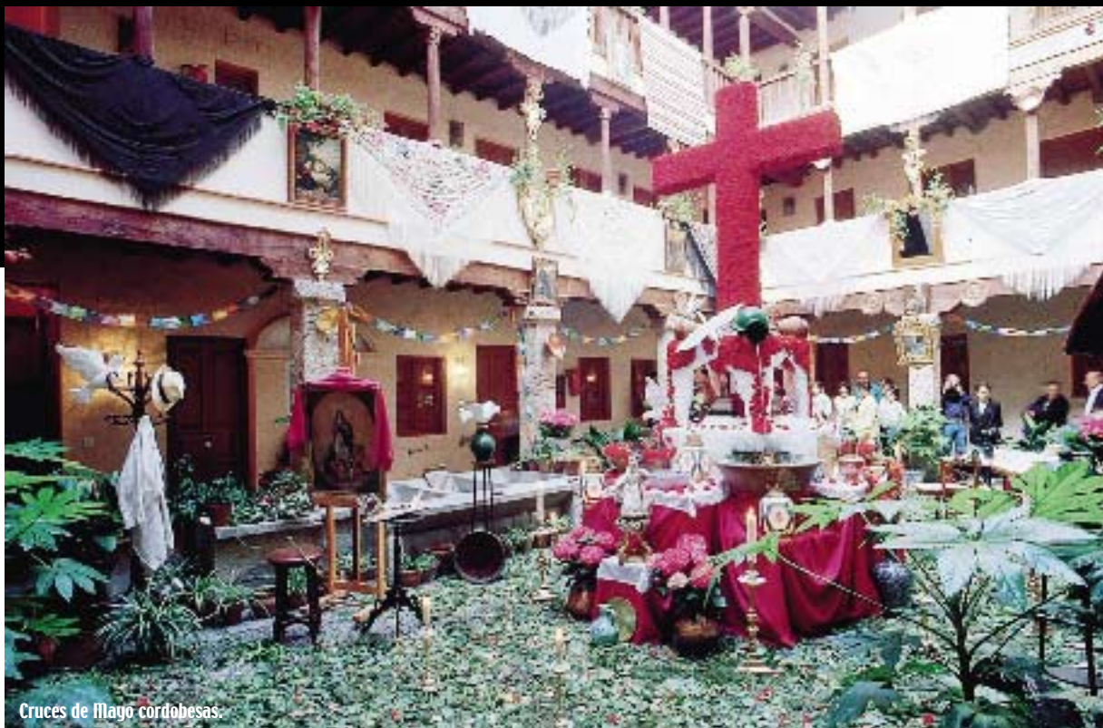
Cruces de Mayo cordobesas.