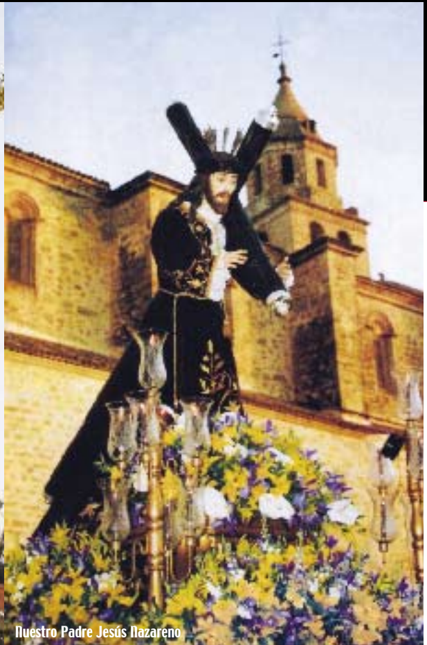
Nuestro Padre Jesús Nazareno

es su Semana Santa, de gran raigambre y tradición. La mayoría de las cofradías que procesionan en la semana de pasión villacarricense fueron fundadas en el siglo XVI, aunque la que procesiona la bella imagen del Cristo de la Expiración data del siglo XV. Por la sobriedad e intensidad con que se vive, destaca el Vía Crucis de penitencia y silencio que tiene lugar en la