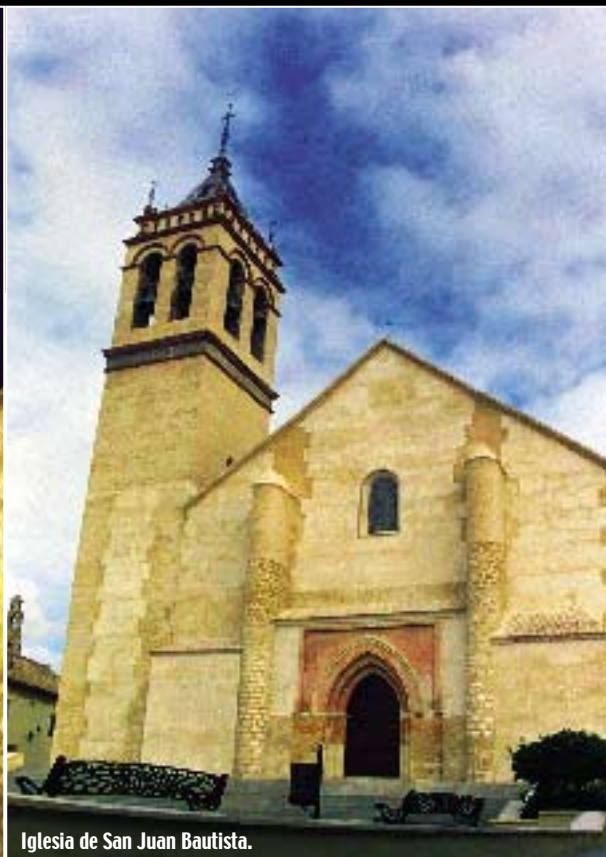
Iglesia de San Juan Bautista.