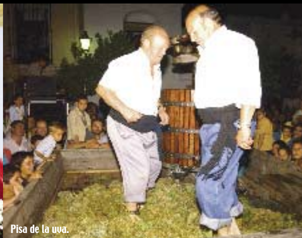
Pisa de la uva.