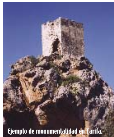
Ejemplo de monumentalidad en Tarifa.

posibilidad de ser la plataforma para conseguir una mayor difusión. La programación se compondrá de las secciones agrupadas alrededor de los siguientes ejes temáticos: la mujer, el sueño africano, la inmigración y una sección especial dedicada a la ciudad de Tánger, localidad con la que Tarifa espera, para las fechas de la Muestra, haber concluido el proceso de hermanamiento actualmente en marcha. La Muestra recopilará algunas de las últimas producciones de ficción del cine africano, tanto largometrajes como cortometrajes, la mayoría realizados en el 2002 y premiados en diversos festivales internacionales. También dedicará una atención especial a la sección documental, ya través de este género los cineastas de este continente expresan su propia visión de la realidad,