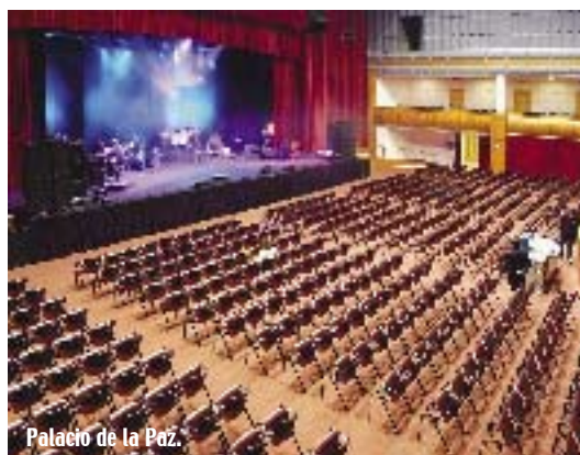
Palacio de la Paz.

El Museo de Historia de la Ciudad se ha unido también a la oferta cultural de Fuengirola, ofreciendo en sus diversas salas un repaso por las sucesivas etapas históricas del municipio. Pero, además de una cita con el arte, el visitante también podrá admirar vestigios históricos en excelente estado de conservación, como el yacimiento romano Finca del Secretario (siglo I), con interesante restos arqueológicos.