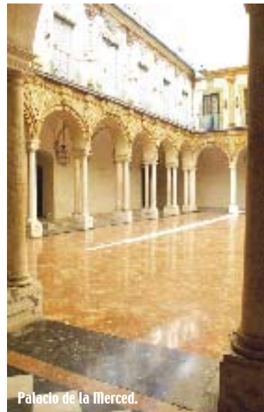
Palacio de la Merced.

Alcázar de los Reyes Cristianos, el Puente Romano o la Judería: estos son sólo una pequeña parte de los méritos que la hacen ser merecedora del título al que aspira. No obstante, el mismo Ayuntamiento de la ciudad ha reconocido la necesidad de emprender una importante labor de modernización cultural. Se llevarán acabo proyectos como el Palacio del Sur; el Teatro de la Axerquía o la construcción de Centro del Arte y de la Imagen (Caico) que acogerá diferentes propuestas artísticas de vanguardia.