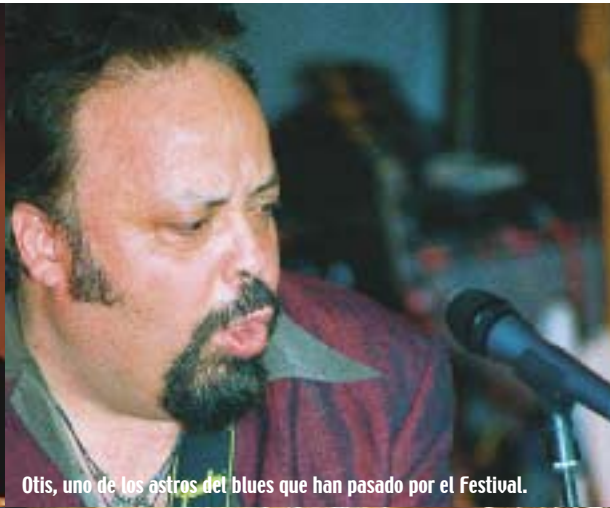
Otis, uno de los astros del blues que han pasado por el Festival.