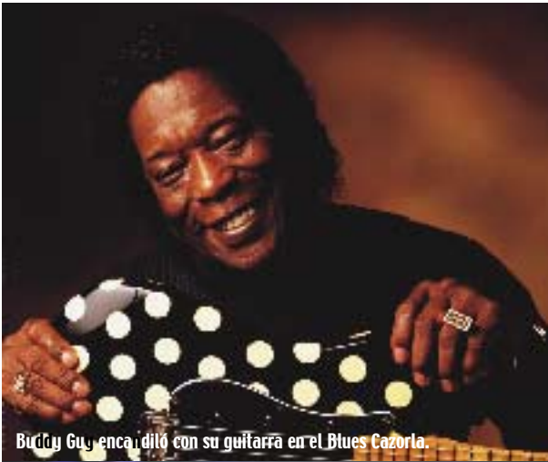
Buddy Guy encantado con su guitarra en el Blues Cazorla.