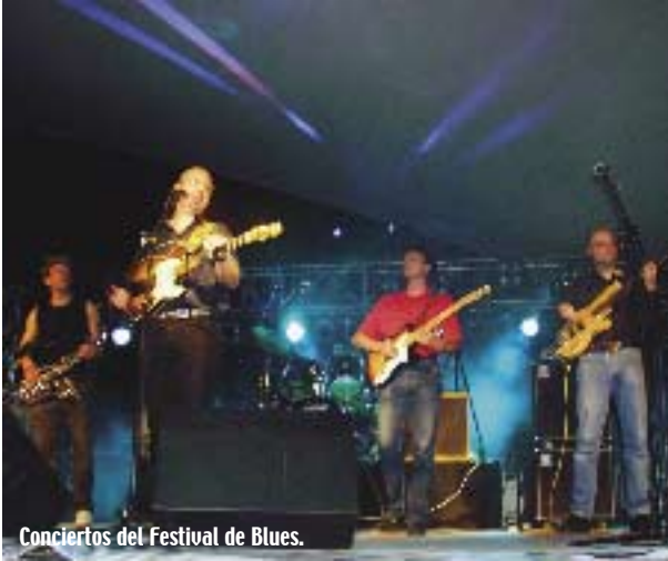
Conciertos del Festival de Blues.