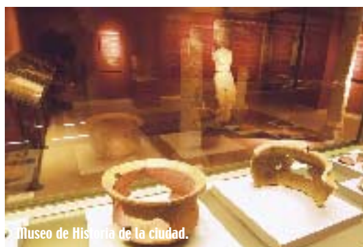
Museo de Historia de la ciudad.