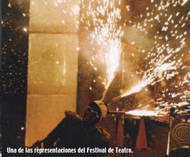
Una de las representaciones del Festival de Teatro.