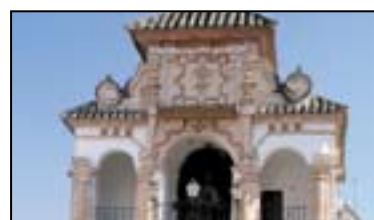
X. EL PORTICHUELO

Siglo XVI. Las obras del templo fueron dirigidas por Diego de Vergara, que también dirigió las de la catedral de Málaga. Los lienzos del Altar Mayor son obra de Antonio Mohedano.