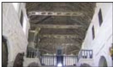
III. IGLESIA DE SAN ZOILO

Del siglo XVI. Destaca por su monumentalidad renacentista, de gran espectacularidad en los muros de su fachada. Recoge retablos y cuadros de iglesias antiguas de la localidad.