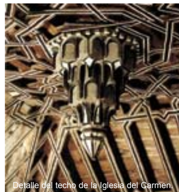
Detalle del techo de la Iglesia del Carmen.