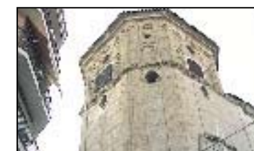
XII. IGLESIA DE MADRE DE DIOS

Siglo XVII. Destacan las pinturas al temple con las que se decoran paredes y bóvedas del interior, además del majestuoso retablo del Altar Mayor, pomposamente decorado.