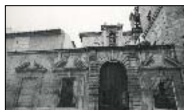
XI. IGLESIA DE LOS REMEDIOS

Siglo XVII. Destacan las pinturas al temple con las que se decoran paredes y bóvedas del interior, además del majestuoso retablo del Altar Mayor, pomposamente decorado.