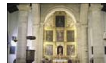
XIII. IGLESIA DE SAN JUAN DE DIOS

Siglo XVIII. Es la única iglesia en el mundo cuya planta está en su totalidad realizada a base de curvas, sin líneas rectas. Su torre está considerada como una de las más bellas del barroco andaluz.