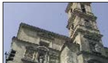
IX. IGLESIA DE SAN AGUSTÍN

Siglo XVI. De interior muy sobrio, el interior repite el modelo de iglesia morisca granadina de una sola nave de cajón y capilla mayor en alto, cubriéndose ambos espacios con artesonados mudéjares.