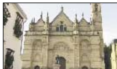
VI. COLEGIATA DE STA. MARÍA LA MAYOR

Siglos XVI-XVII. Destaca el retablo del Altar Mayor, uno de los mejores del barroco andaluz, su artesonado mudéjar y su rica colección de imágenes policromadas.