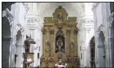
I. IGLESIA DE LA TRINIDAD

Fue levantada entre 1672 y 1683. El interior tiene planta de cruz latina, cúpula en el crucero y capillas laterales comunicadas, formando naves. Destaca la sacristía, cuya decoración tiene influencia oriental.