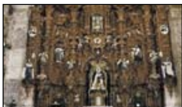
V. IGLESIA DEL CARMEN

Siglo XVII. A tener en cuenta su maravillosa fachada barroca atribuida a Tomás de Melgarejo. Esta fachada responde al esquema compositivo carmelitano, aunque con abundancia de figuras paganas.