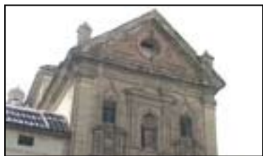
IV. IGLESIA DE SAN JOSÉ

Templo gótico, declarado Monumento Nacional. Destaca su portada de piedra arenisca, con arco carpanel de arquivoltas y finas columnillas, todo ello decorado con el cordón franciscano anudado.