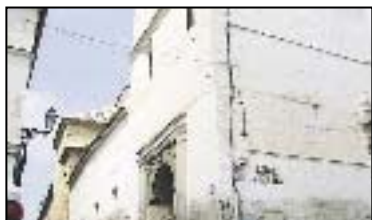
VIII. IGLESIA DE LA ENCARNACIÓN

Siglo XVI. Es la iglesia mayor de la ciudad, enclavada en una plaza renacentista. Su torre barroco-mudéjar se corona con una veleta conocida como "El Angelote".