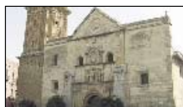
VII. IGLESIA DE SAN SEBASTIÁN

Siglo XVI. Se trata del primer templo renacentista andaluz e inspiró a Alonso Cano para la portada de la catedral de Granada. Acogió una escuela de gramática.