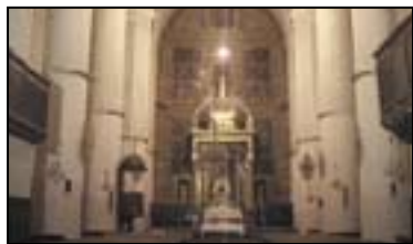
II. IGLESIA DE SAN PEDRO

Fue levantada entre 1672 y 1683. El interior tiene planta de cruz latina, cúpula en el crucero y capillas laterales comunicadas, formando naves. Destaca la sacristía, cuya decoración tiene influencia oriental.