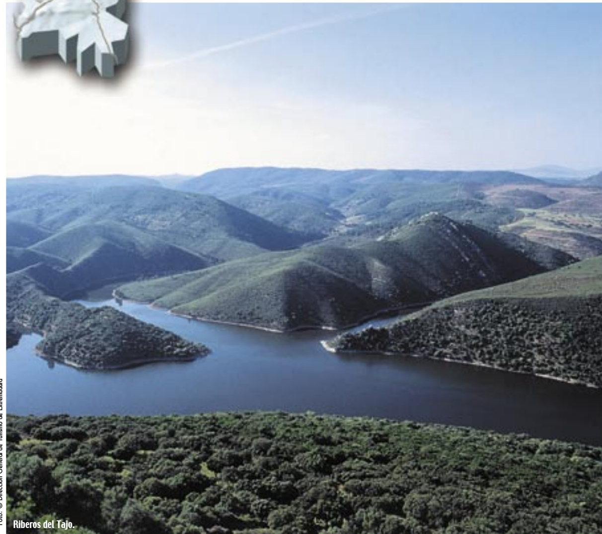
Riberos del Tajo.