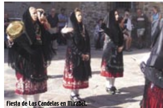
Fiesta de Las Candelas en Mirabel.