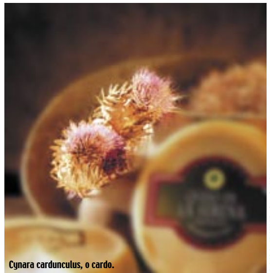
Cynara cardunculus, o cardo.

Esta profunda historia conlleva tradiciones que sus habitantes conservan y cuidan. Buena muestra de ello son las múltiples celebraciones, entre las que destacan la Romería de Piedra Escrita en Campanario, a la que acuden vecinos de todos los pueblos de la comarca, y que ha sido declarada de Interés Turístico de Extremadura, y la Fiesta de la Octava del Corpus, en la que se conmemora la victoria sobre los árabes de la toma del castillo de Capilla..