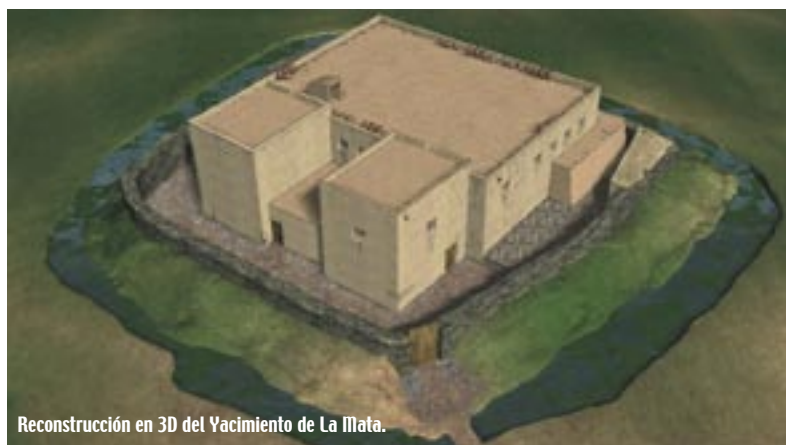
Reconstrucción en 3D del Yacimiento de La Mata.

La ruta se inicia en Benquerencia de La Serena, población con antecedentes prehistóricos como lo demuestra la existencia de distintos abrigos de pinturas rupestres de entre los años 3.000 y 5.000 a. de C. Uno de los monumentos con más trascendencia histórica es su Castillo medieval, donde se funden las tradiciones musulmanas de los siglos XI y XII y las cristianas con posterioridad a la Reconquista.