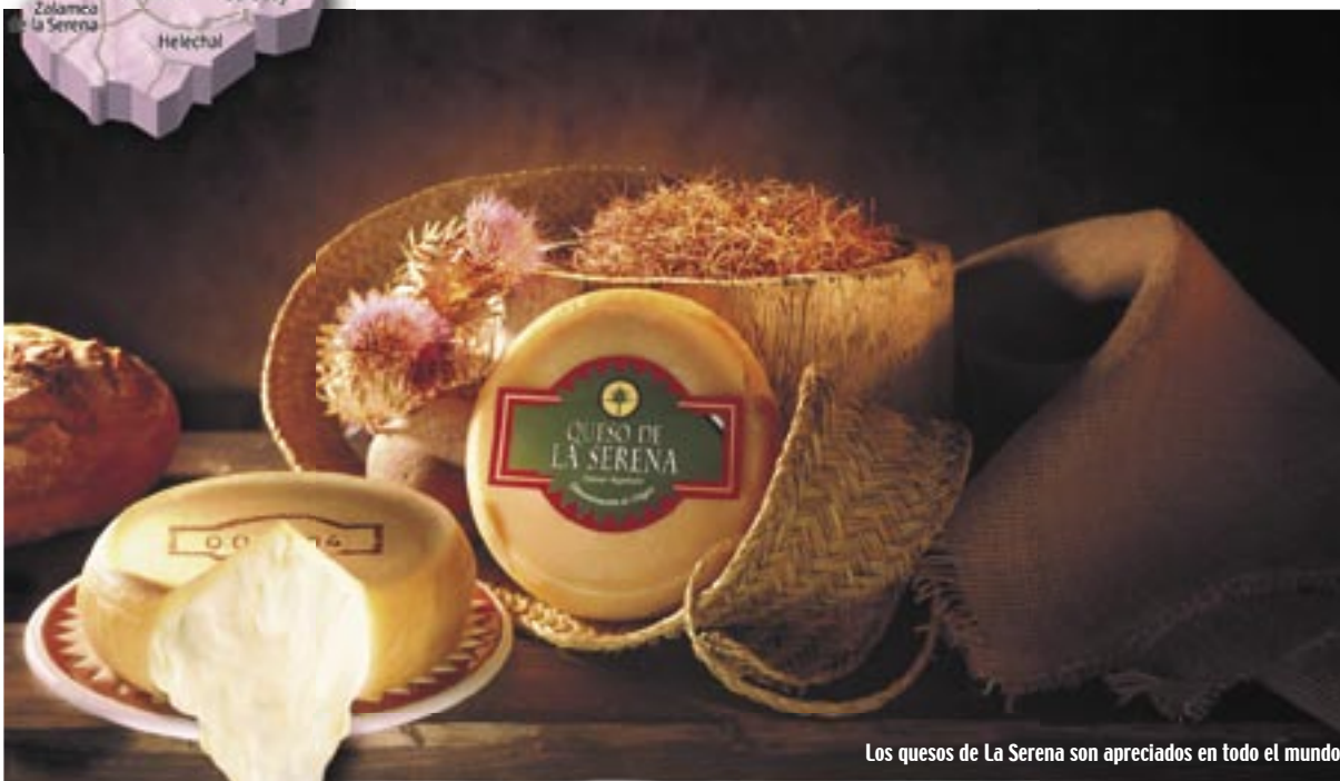
Los quesos de La Serena son apreciados en todo el mundo.