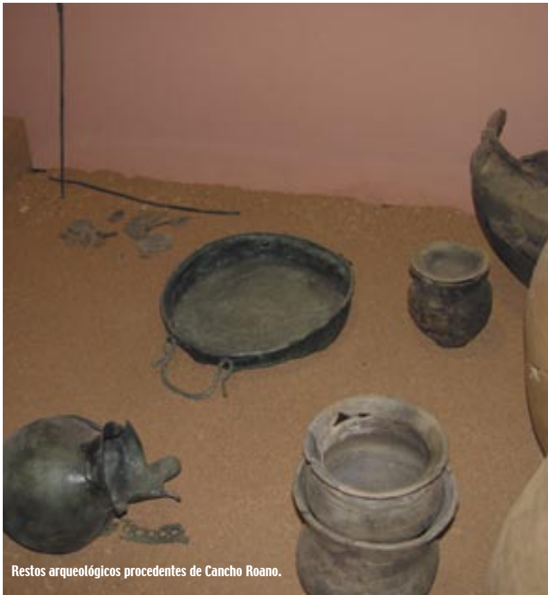
Restos arqueológicos procedentes de Cancho Roano.