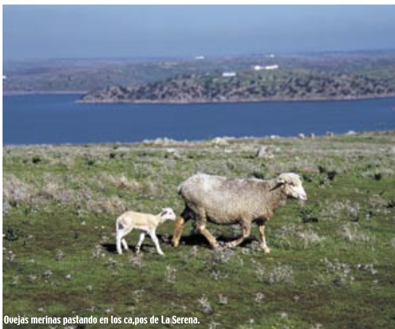
Ovejas merinas pastando en los campos de La Serena.

La oveja Merina es un animal de excepcionales cualidades, que por su rusticidad, y al pacer en una tierra extrema, permiten el milagro de ofrecer una leche de alto contenido proteico y materia grasa con la que se elaboran los quesos y tortas de esta Denominación de origen. Además de disfrutar de este manjar culinario, la visita a la comarca de la Serena ofrece también la posibilidad de disfrutar del patrimonio y la costumbres de una tierra de historia fecunda. A destacar la presencia de la Orden de Alcántara, que la