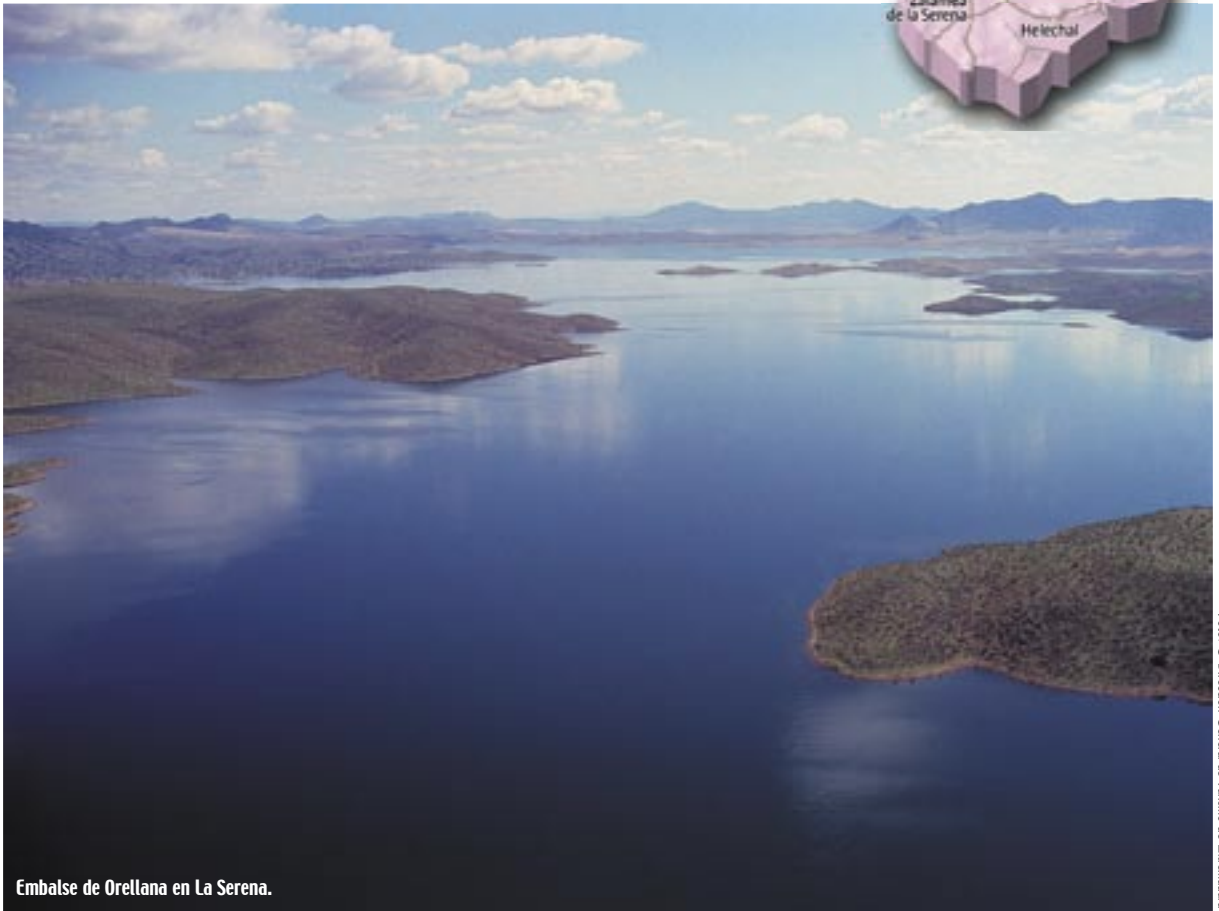
Embalse de Orellana en La Serena.