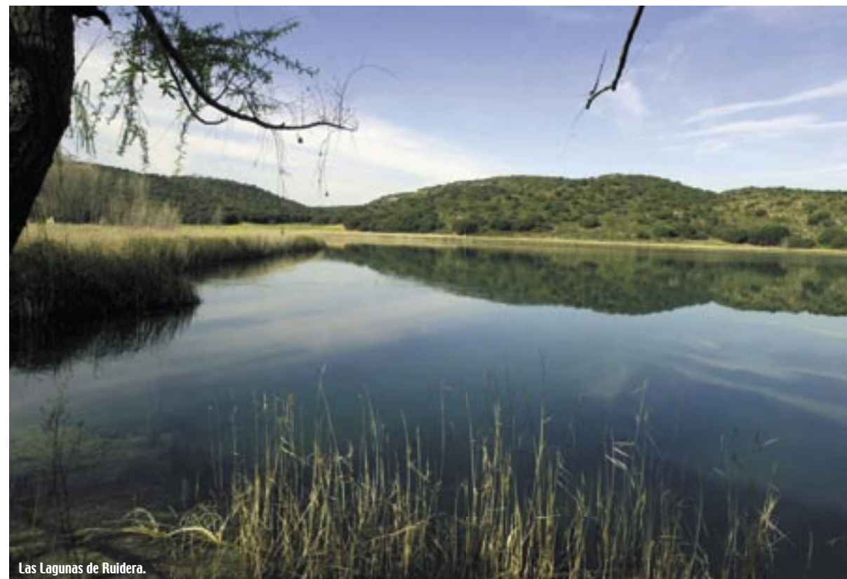
Las Lagunas de Ruidera.