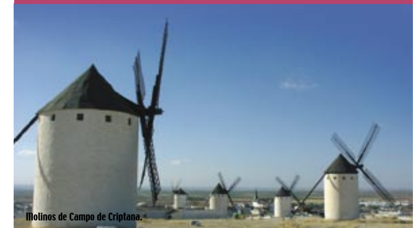
Molinos de Campo de Criptana.