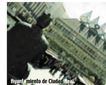
Ayuntamiento de Ciudad Real.