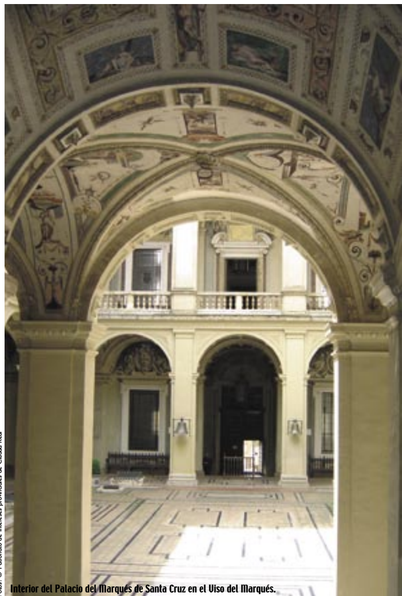
Interior del Palacio del Marqués de Santa Cruz en el Viso del Marqués.

Almagro. Conocida como la ciudad de los encajes porque ya en los siglos XVII y XVIII fue sede de las Reales Fábricas de Encajes y Blondas. Entre los monumentos que no podemos perdernos destacan la Iglesia de San Bartolomé, Iglesia de la Madre de Dios, San Agustín, sus Conventos, Palacios, el Ayuntamiento en la Plaza Mayor, Teatro Municipal, Museo del Teatro y Corral de Comedias.