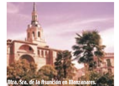
Iglesia de la Asunción en Manzanares.

destaca la plaza de toros cuadrada más antigua de España, construida en 1645. Situada en Las Virtudes, junto al Santuario de la Virgen de las Virtudes.