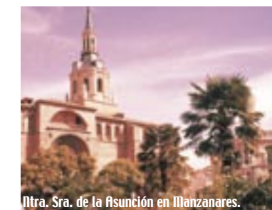
Iglesia de la Asunción en Manzanares.

destaca la plaza de toros cuadrada más antigua de España, construida en 1645. Situada en Las Virtudes, junto al Santuario de la Virgen de las Virtudes.