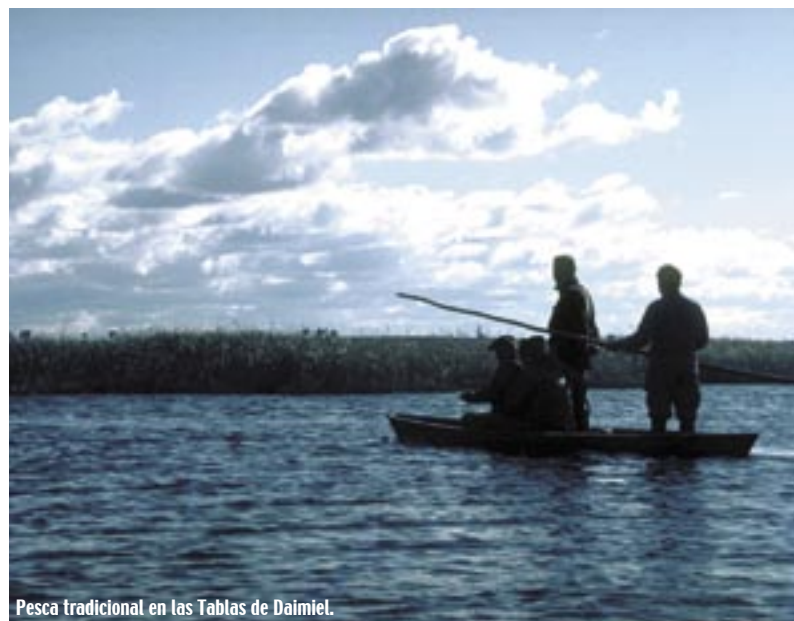
Pesca tradicional en las Tablas de Daimiel.