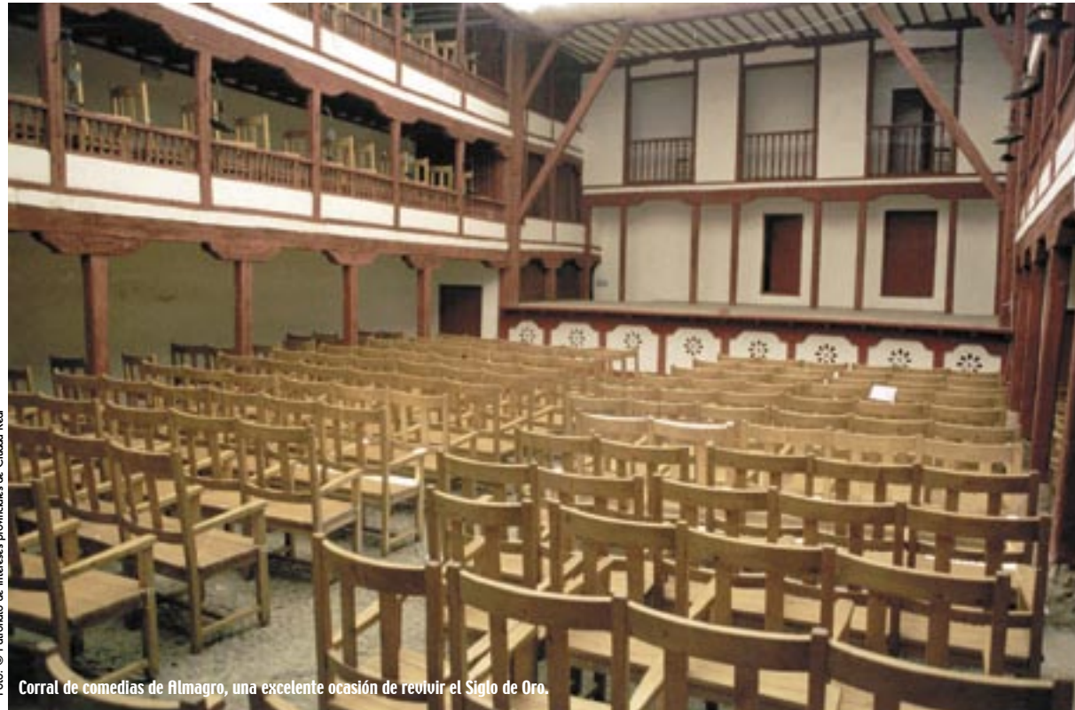
Corral de comedias de Almagro, una excelente ocasión de revivir el Siglo de Oro.