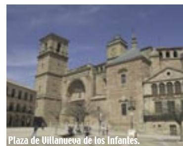
Plaza de Villanueva de los Infantes.