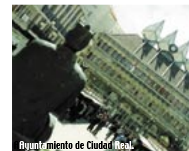
Ayuntamiento de Ciudad Real.