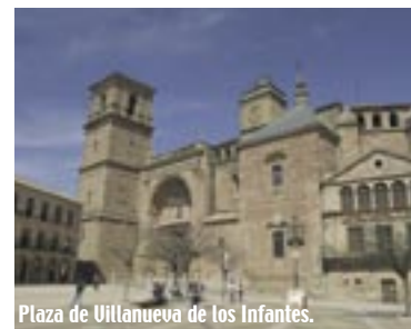
Plaza de Villanueva de los Infantes.