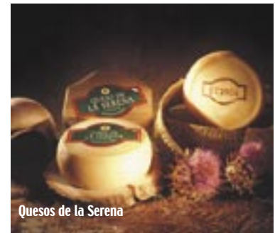
Quesos de la Serena