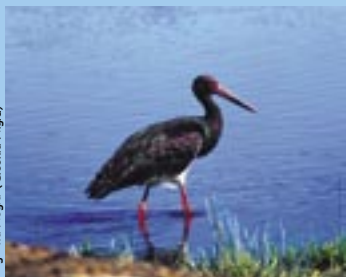
Cigüeña Negra ( Ciconia nigra )

– El Águila Imperial Ibérica ( Aquila adalberti ), cuya población mundial es de unas 150 parejas reproductoras, confinadas exclusivamente en nuestro país, y de la que una tercera parte se encuentra en Extremadura. Las principales poblaciones se encuentran en Monfragüe (11 parejas) y Sierra de San Pedro (20 parejas).