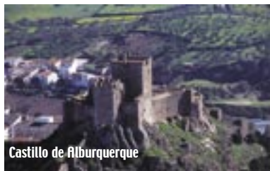
Castillo de Alburquerque