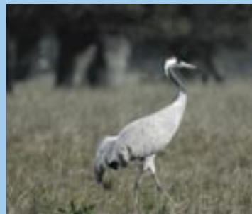
Grulla ( Grus grus )

– El Aguilucho Cenizo ( Circus pygargus ) es el ave rapaz que más ha disminuido en Europa en los últimos años, ya que al nidificar en el suelo, se ve afectada por todas las transformaciones y tratamientos que sufren los campos. En Extremadura está la tercera parte de la población europea (1.500-2.000 parejas).