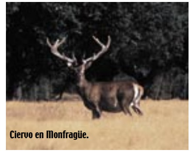
Ciervo en Monfragüe.