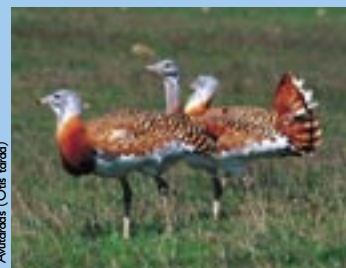
Avutarda ( Otis tarda )

– La Avutarda ( Otis tarda ) tiene una población total, a nivel mundial, de unas 22-25.000 aves, repartidas en gran parte por el continente eurasiático. España es la zona más