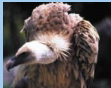
Buitre Leonado ( Gyps fihardi )

– El Sisón ( Tetrax tetrax ) está desapareciendo rápidamente e inesperadamente de sus principales reductos del norte de África y este de Europa. Sólo en la Península Ibérica existe aún una población notable, parte muy importante de la cual habita en Extremadura.