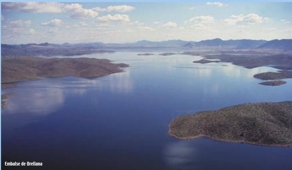
Embalse de Orellana