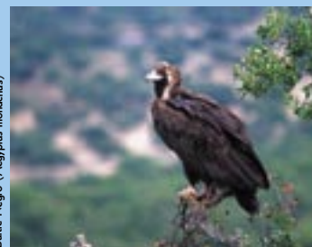
Buitre Negro ( Aegypius monachus )

– El Buitre Negro ( Aegypius monachus ) ha sufrido en el último siglo una drástica reducción de su área de distribución y de sus efectivos. Extremadura cuenta con casi 650 parejas, lo que viene a representar alrededor del 50%