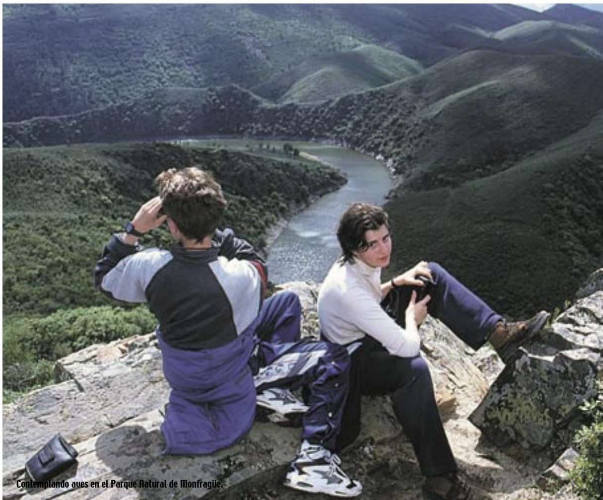
Contemplando aves en el Parque Natural de Monfragüe.