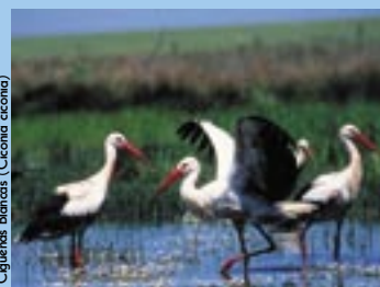
Cigüeñas Blancas ( Ciconia ciconia )

– La Cigüeña Blanca ( Ciconia ciconia ) ha sufrido en este siglo una grave regresión en toda Europa occidental, donde España, con algo más de 17.000