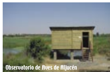
Observatorio de Aves de Aljucén