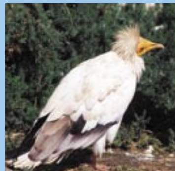
Alimoché ( Nepophon percipitans )