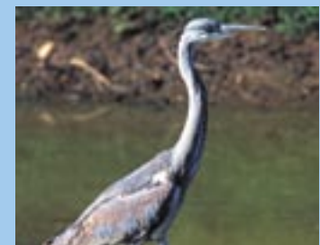
Grulla real ( Ardea cinerea )

(Datos recopilados por ADENEX Asociación para la Defensa de la Naturaleza y los Recursos de Extremadura en www.adenex.org )