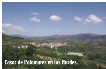
Casas de Palomares en las Hurdes.