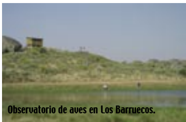
Observatorio de aves en Los Barruecos.