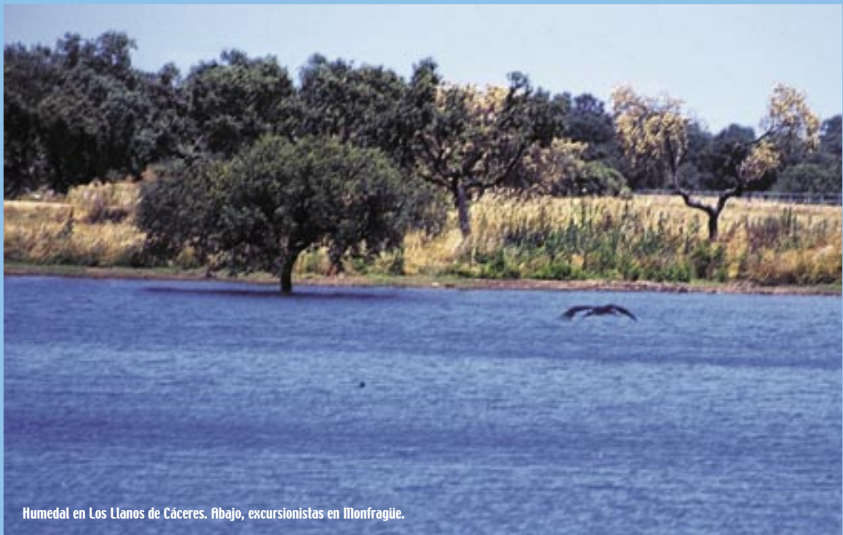
Humedal en Los Llanos de Cáceres. Abajo, excursionistas en Monfragüe.