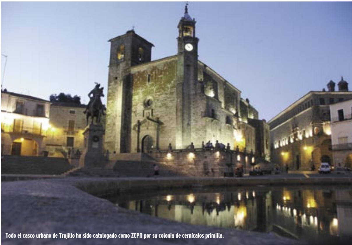
Todo el casco urbano de Trujillo ha sido catalogado como ZEPA por su colonia de cernícalos primilla.