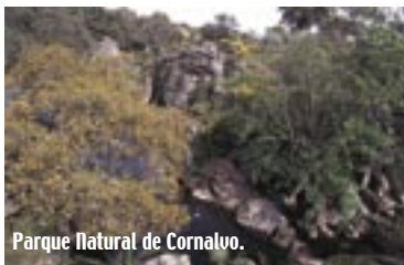
Parque Natural de Cornalvo.