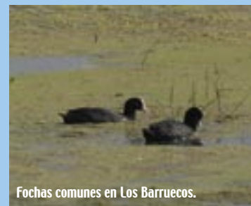
Fochas comunes en Los Barruecos.

Y, por supuesto, Naturaleza. Es difícil extraer una sencilla