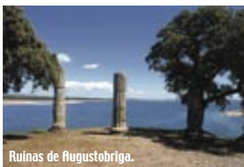
Ruinas de Augustobriga.