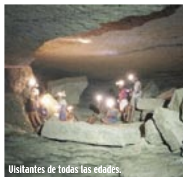
Visitantes de todas las edades.