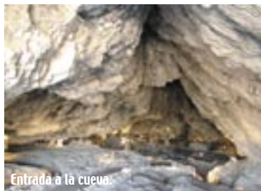
Entrada a la cueva.