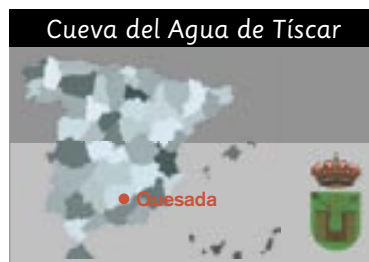
Cueva del Agua de Tíscar

Dirección, información y reservas: Casa de la Cultura. Pza. Cesáreo Rodríguez, 4. 23480 Quesada (Jaén) Tel. 953 733 133. Fax. 953 714 123 E-mail: jalopezvilchez@yahoo.es www.museozabaleta.org