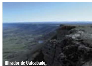
Mirador de Valcabado.