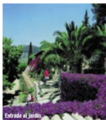
Entrada al jardín.