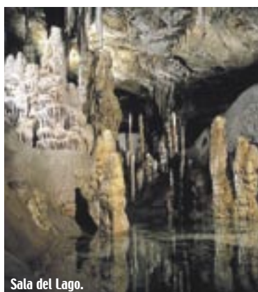
Sala del Lago.