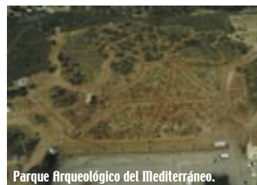
Parque Arqueológico del Mediterráneo.