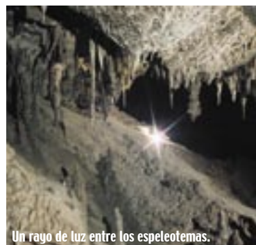
Un rayo de luz entre los espeleotemas.