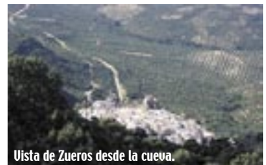
Vista de Zuheros desde la cueva.