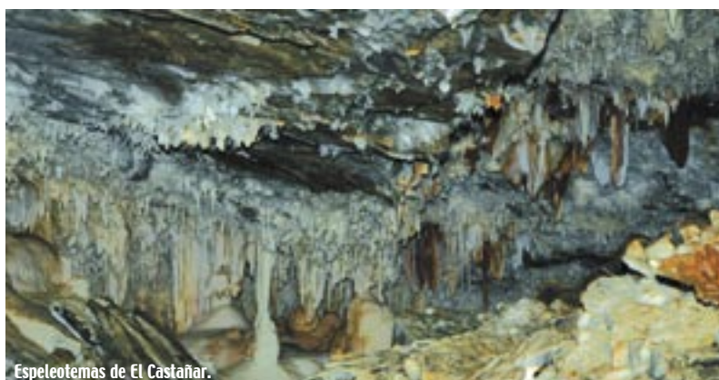
Espeleotemas de El Castañar.