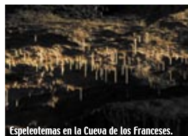
Espeleotemas en la Cueva de los Franceses.