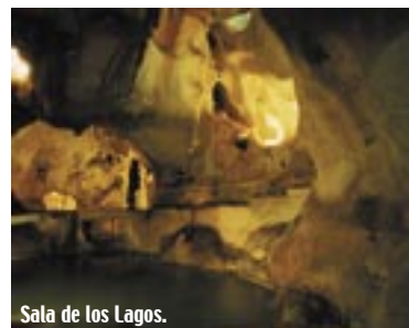
Sala de los Lagos.