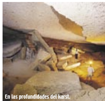
En las profundidades del karst.