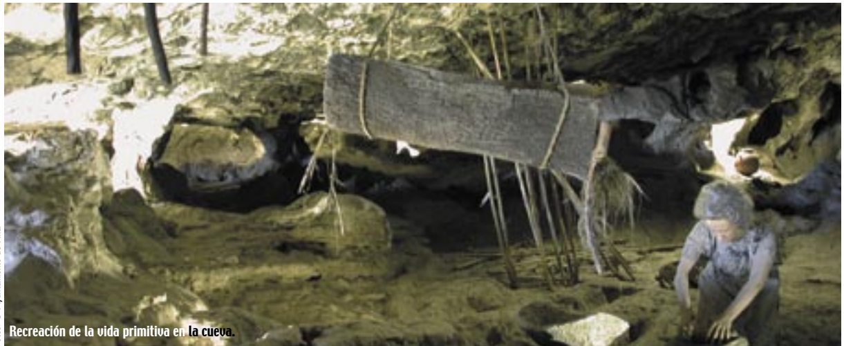
Recreación de la vida primitiva en la cueva.