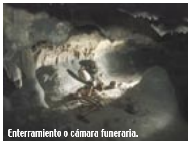
Enterramiento o cámara funeraria.