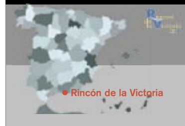
● Rincón de la Victoria