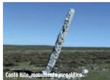
Canto Hito, monumento megalítico.