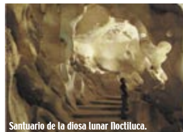
Santuario de la diosa lunar Noctiluca.