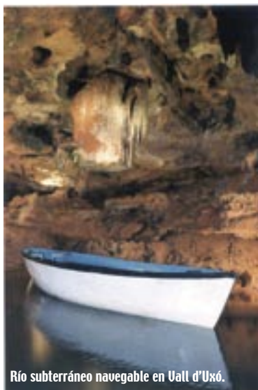
Río subterráneo navegable en Uall d'Uxó.

La habilitación de determinadas cuevas constituye un mecanismo de acercamiento de la realidad del mundo subterráneo al conjunto de la sociedad, que debe inspirarse