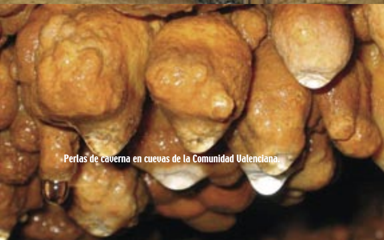
Perlas de caverna en cuevas de la Comunidad Valenciana.