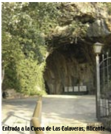
Entrada a la Cueva de Las Calaveras, Alicante