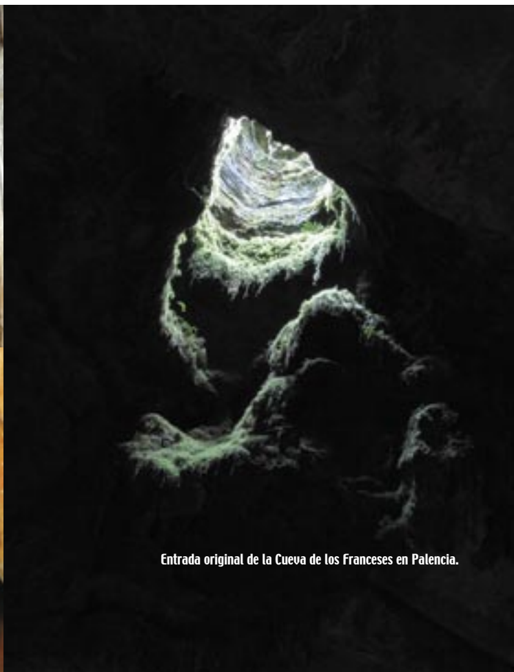
Entrada original de la Cueva de los Franceses en Palencia.