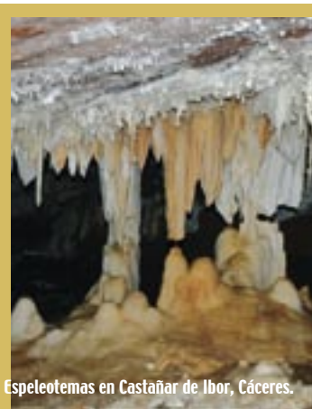
Espeleotemas en Castañar de Ibor, Cáceres.

comparten entre sus objetivos la protección del medio subterráneo, su divulgación y la necesidad de un uso sostenible del mismo.