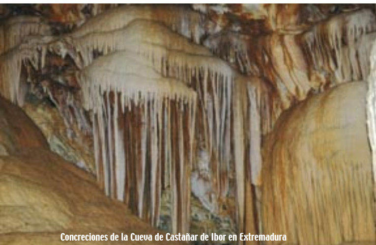
Concreciones de la Cueva de Castañar de Ibor en Extremadura

Espeleología y turismo subterráneo son realidades complementarias. Los gestores de las cuevas turísticas y los espeleólogos