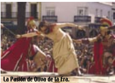
La Pasión de Oliva de la Fra.