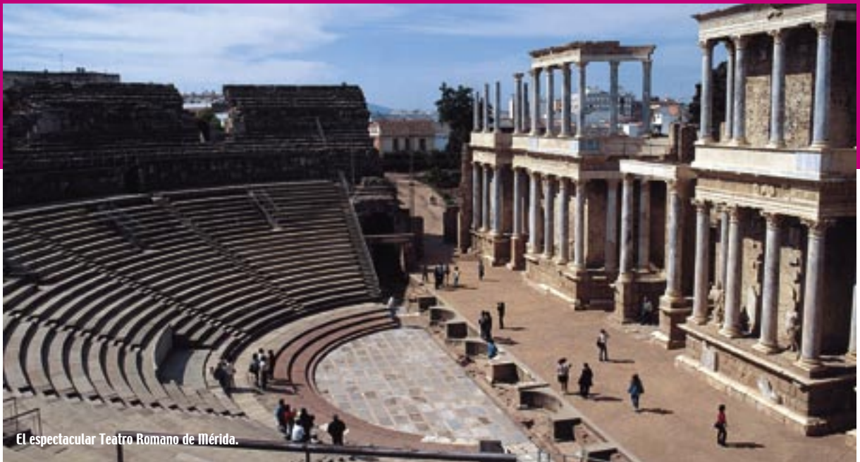
El espectacular Teatro Romano de Mérida.