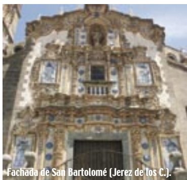
Fachada de San Bartolomé (Jerez de los C.).