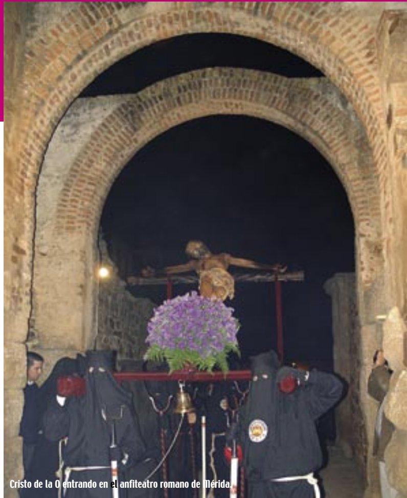
Cristo de la O entrando en el anfiteatro romano de Mérida.