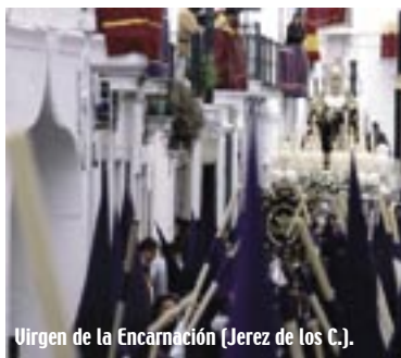
Virgen de la Encarnación (Jerez de los C.).