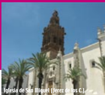
Iglesia de San Miguel (Jerez de los C.).