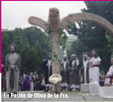
La Pasión de Oliva de la Fra.