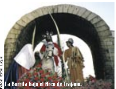
La Burrita bajo el Arco de Trajano.