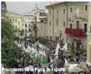
Procesiones en la Plaza de España.