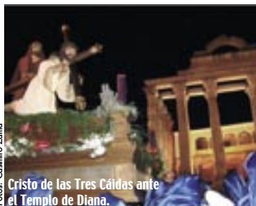
Cristo de las Tres Caídas ante el Templo de Diana.