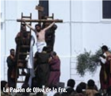
La Pasión de Oliva de la Fra.