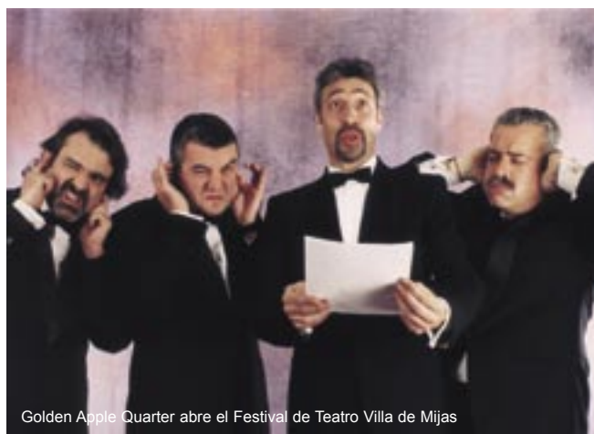
Golden Apple Quarter abre el Festival de Teatro Villa de Mijas