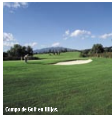
Campo de Golf en Mijas.