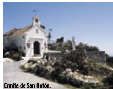
Ermita de San Antón.