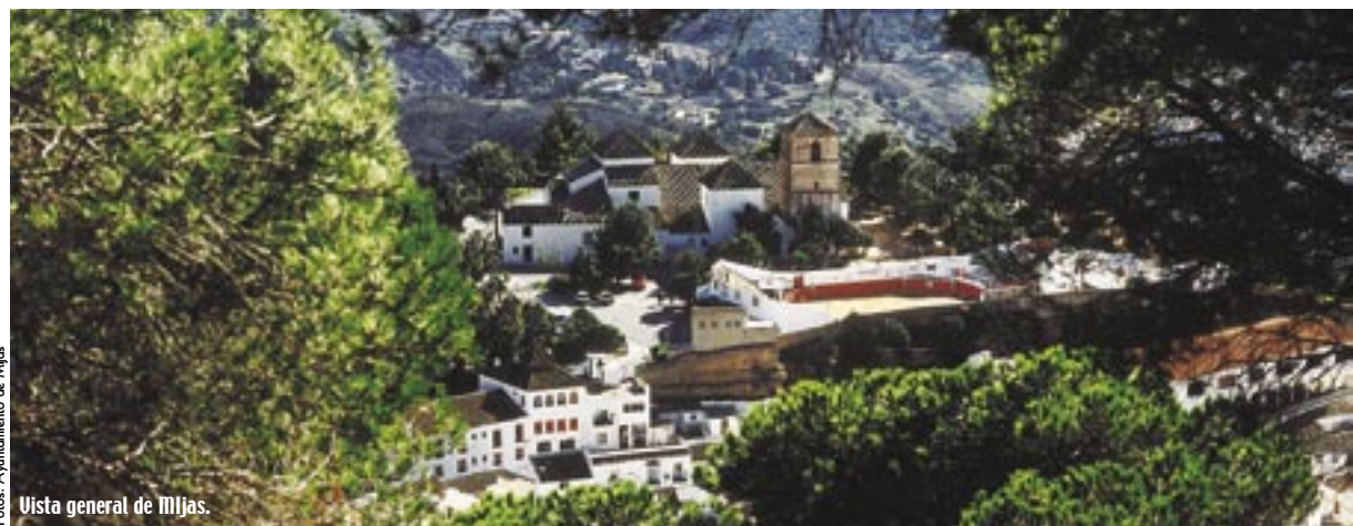
Uista general de Mijas.