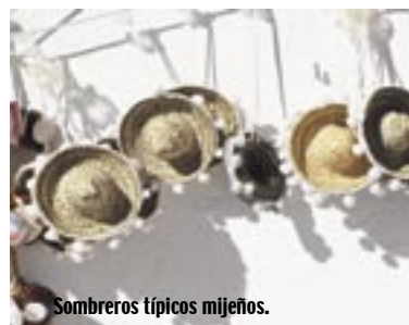
Sombros típicos mijeños.