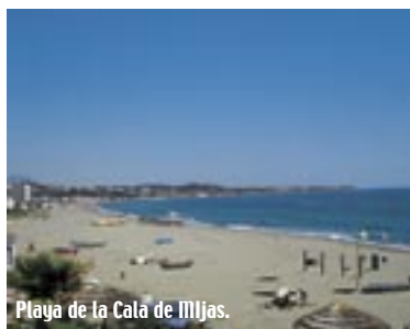
Playa de la Cala de Mijas.