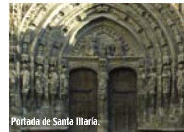
Portada de Santa María.