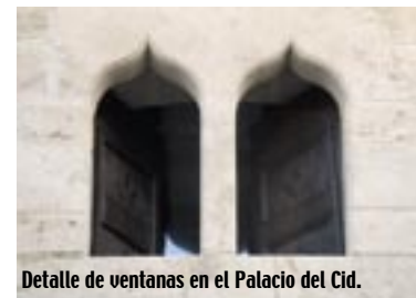
Detalle de ventanas en el Palacio del Cid.