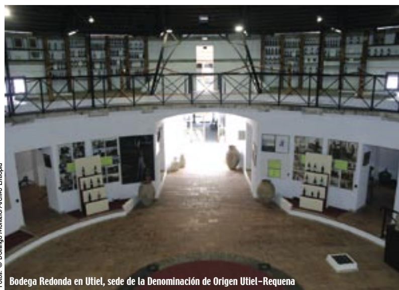
Bodega Redonda en Utiel, sede de la Denominación de Origen Utiel-Requena

embutidos (longaniza, morcilla, chorizo, salchichón, sobrasada, el "perro" y la "güeña") o el arroz en cazuela.