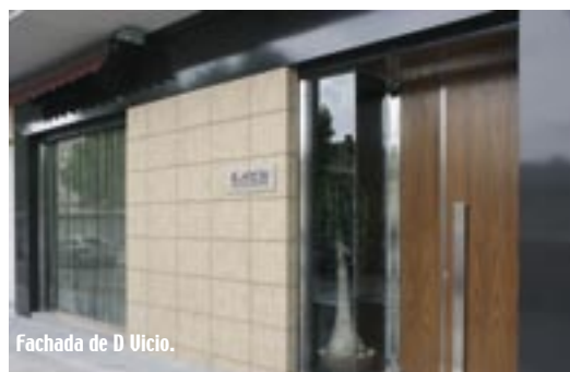
Fachada de D Vicio.

los embutidos como producto estrella, orgullo de los artesanos y reconocido por su calidad. Además de la proximidad de la Mancha, con la que limita, el clima ha hecho que los platos fuertes, derivados del cerdo en su mayoría, se impongan entre sus manjares: morteruelo,