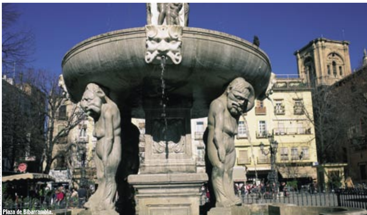
Plaza de Bibarrambla.