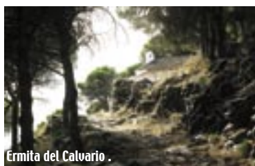
Ermita del Calvario .