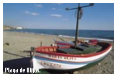
Playa de Mijas.