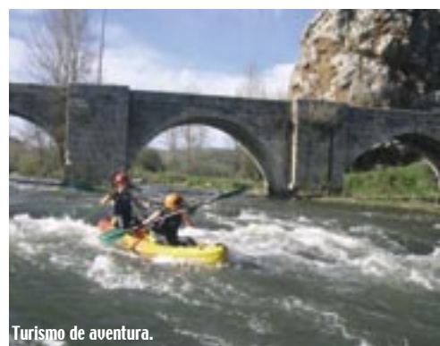
Turismo de aventura.