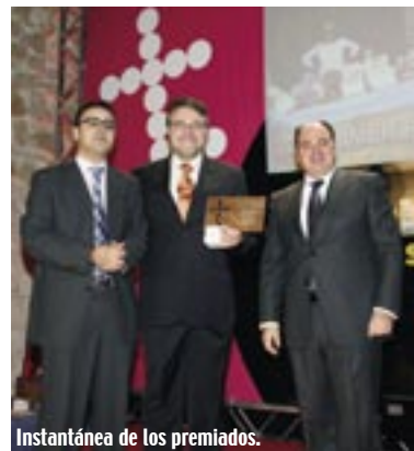
Instantánea de los premiados.