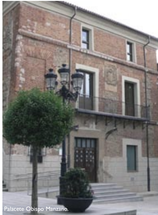
Palacete Obispo Manzano.