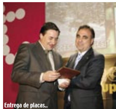
Entrega de placas..