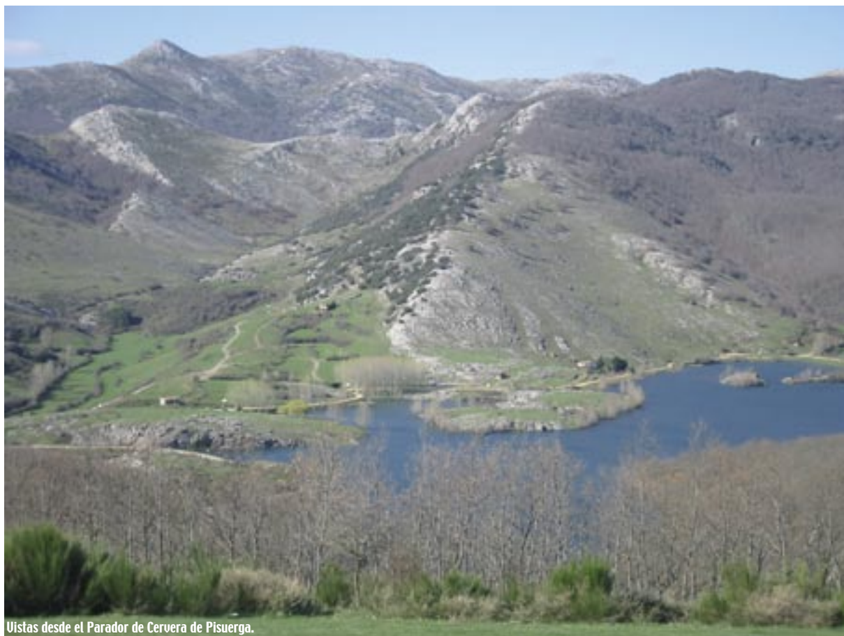
Vistas desde el Parador de Cervera de Pisuerga.