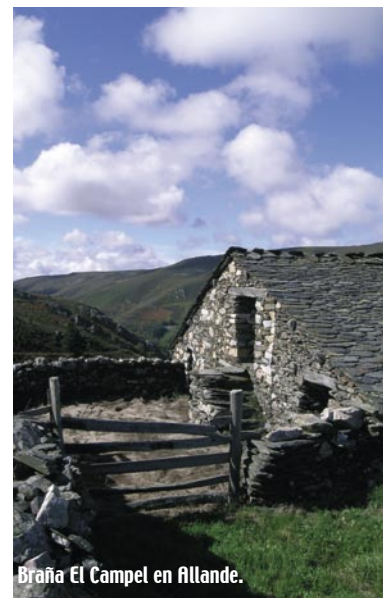
Braña El Campel en Allande.

paneras y hórreos tradicionales. Y si se quiere disfrutar de la esencia y el espectacular paisajismo de las brañas vaqueiras se puede visitar Bustellán, Cezures, Folgueras del Río, Naraval, Businán, Busmeón, Las Tabiernas o Folgueras del Río.