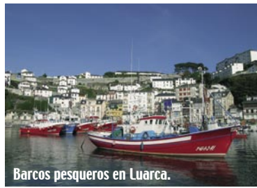
Barcos pesqueros en Luarca.