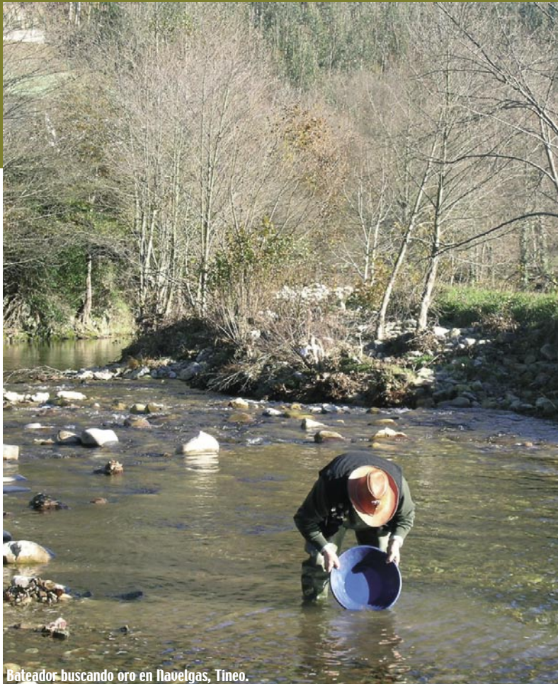
Bateador buscando oro en Navelgas, Tineo.