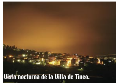
Vista nocturna de la Villa de Tineo.