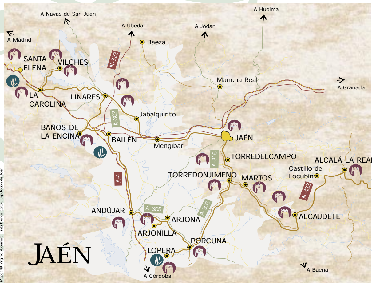
Mapas: © Virginia Alcántara. Tinta Blanca Editor. Diputación de Jaén

Monumento a las batallas en La Carolina, donde tuvo lugar el choque de las Navas de Tolosa entre cristianos y árabes. Arriba, tumba del General Castaños en Bailén. En el centro, restos de murallas y alcazaba de Andújar. Abajo, Torre de la Vela en el Castillo de Santa Catalina de Jaén.