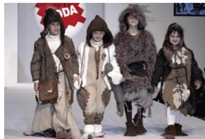
Aspecto general de la FITC de Málaga