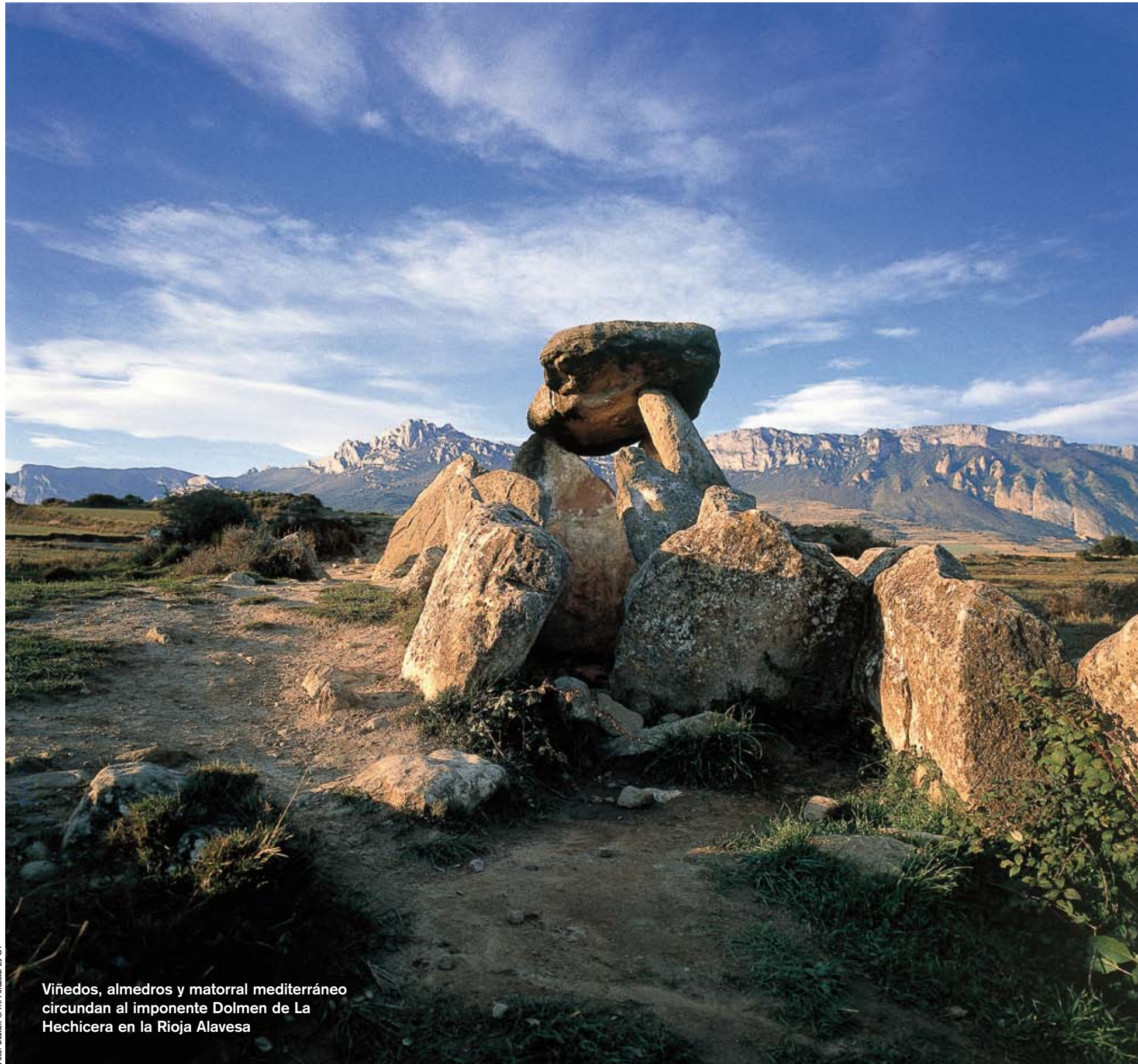
Viñedos, almedros y matorral mediterráneo circundan al imponente Dolmen de La Hechicera en la Rioja Alavesa